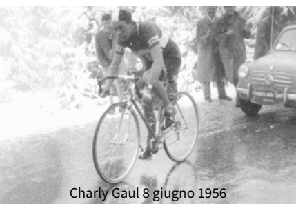
Charly Gaul 8 giugno 1956

www.discoverrento.it booking@discoverrento.it